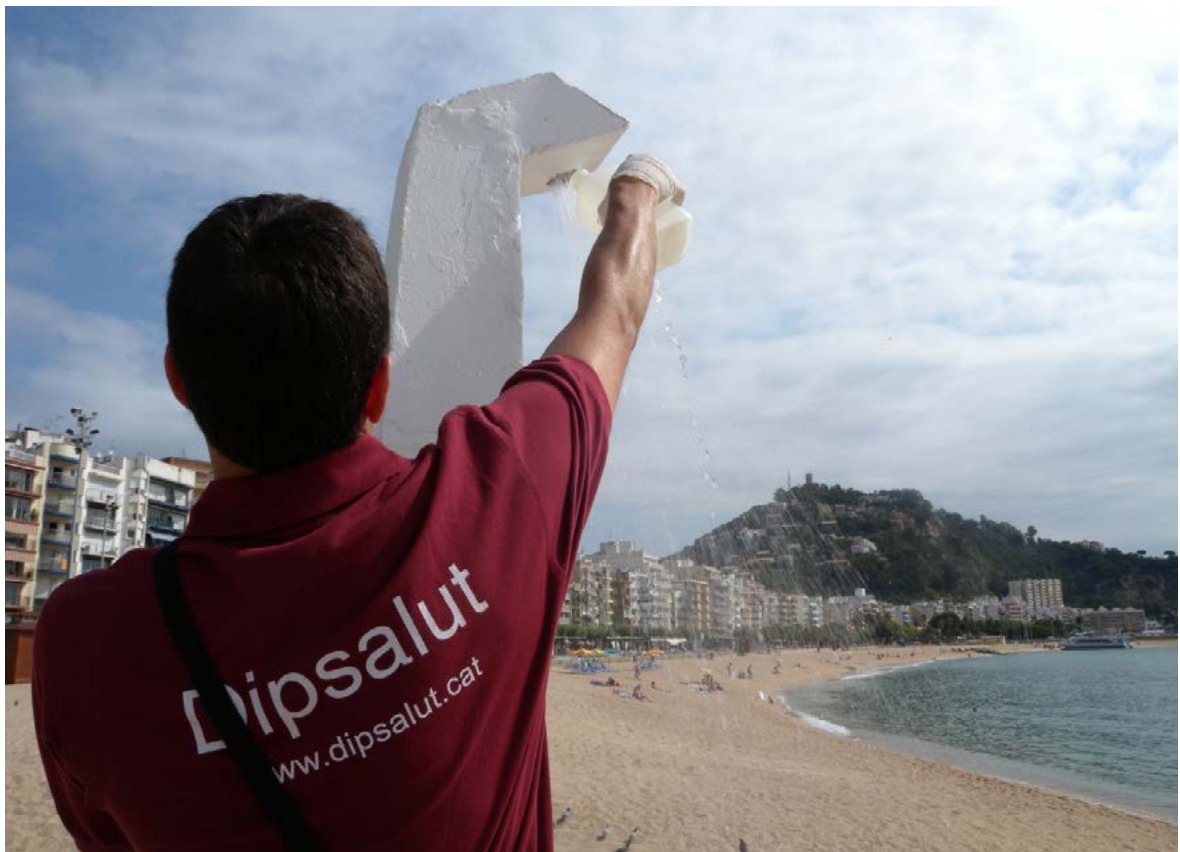
Fotografia d'arxiu de presa de mostra d'aigua per al control de legionel·la