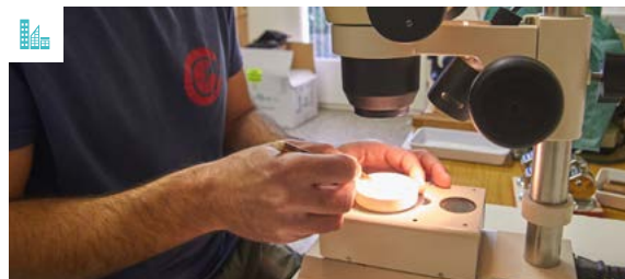
Fotografia d'arxiu del Servei de Control de Mosquits

Les actuacions per al control d'aquest insecte es consideren imprescindibles perquè pot transmetre nombroses malalties, com, per exemple, el dengue, el zika o el chikungunya. Cal remarcar, però, que ni aquest ni els altres mosquits poden contagiar la Covid-19.