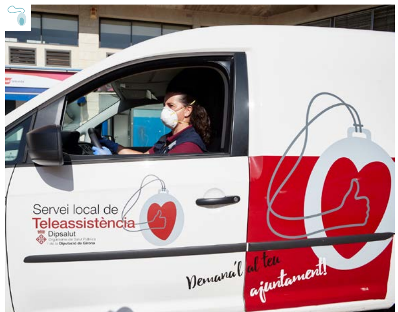
Unitat mòbil del Servei local de Teleassistència.

de la simptomatologia de la Covid i de resoldre dubtes dels usuaris. A més, es posen a la seva disposició per poder assegurar-ne el benestar, tant pel que fa a necessitats materials bàsiques, com també d'acompanyament emocional en una situació que genera por, incertesa i soledat. S'ha de tenir en compte que bona part de les persones usuàries de la teleassistència pública viuen soles i amb molt poca possibilitat d'interacció social.