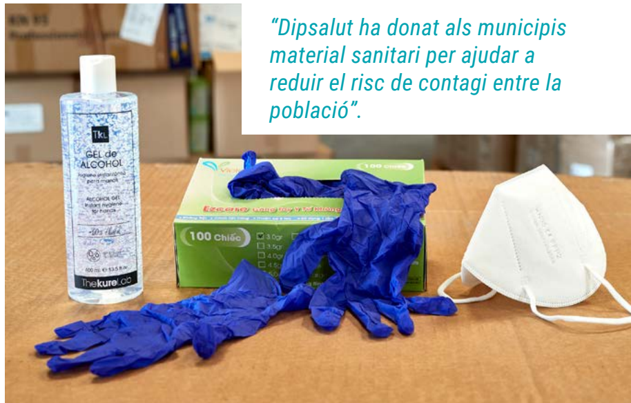
Materials cedits.

“Dipsalut ha donat als municipis material sanitari per ajudar a reduir el risc de contagi entre la població”.