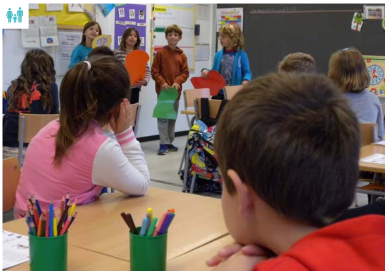
Sessió del «Sigues tu» a l'escola Gonçal Comellas d'Avinyonet de Puigventós.

Des del passat mes de març, els professionals del "Sigues tu" i la