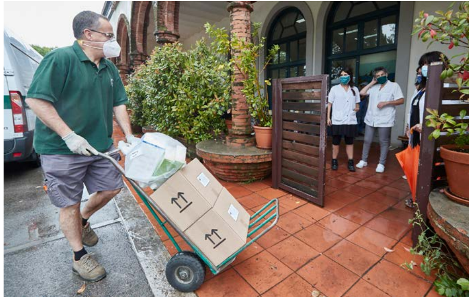
Fotografia d'un dels lliuraments de material.

A més, des de la Diputació de Girona es continua treballant en la provisió de materials de protecció atès que la situació pot perdurar en el temps. El president de l'ens, Miquel Noguer i Planas, també va assenyalar en el ple de la corporació que «si hi ha rebrots, tindrem estoc de