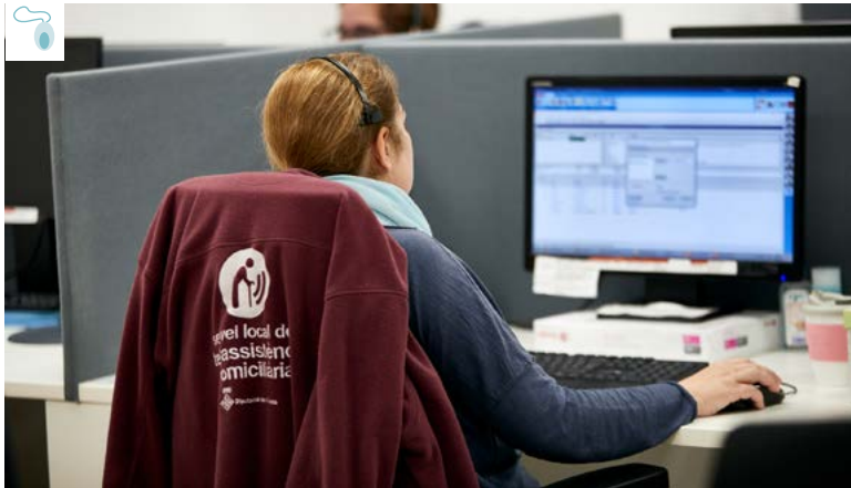
Una de les teleoperadores al Centre d'Atenció del Servei.

El Servei local de Teleassistència s'ha adaptat a la realitat imposada per la Covid-19 introduint, ja des dels inicis de la pandèmia, nombrosos canvis com el reforç del seguiment, acompanyament i suport als usuaris més vulnerables.