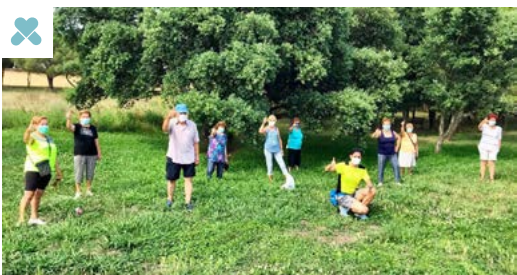
Fotografia d'una sessió

poder respectar-les, usar contínuament la mascareta