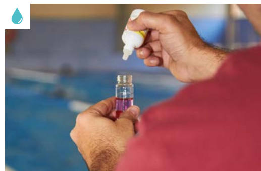
Fotografia d'arxiu d'una de les actuacions a piscines municipals

L'objectiu de les diferents actuacions incloses en tots dos programes és vetllar per a la seguretat dels usuaris d'aquestes ins-