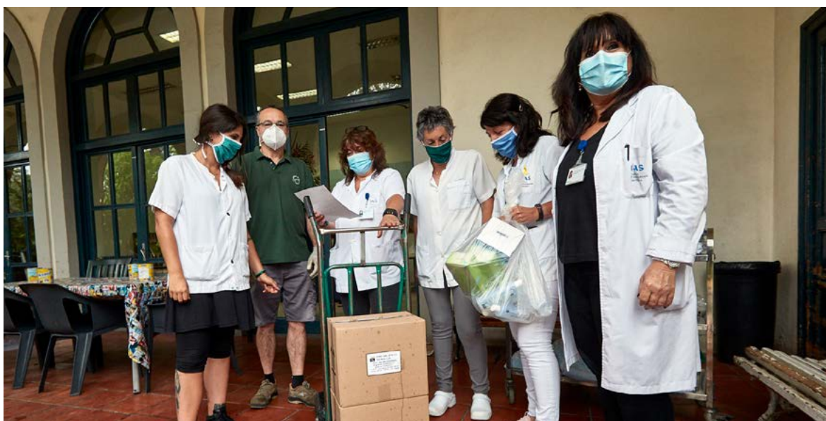
Fotografia d'un dels lliuraments de material.