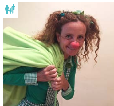
Obra de teatre per a casals d'estiu. Companyia La Bleda

Aquest curs 2020/21, el nostre programa d'educació per a la salut incorpora novetats (a banda de la necessària adaptació als protocols per la Covid-19): nous materials per a educació infantil, una eina d'autoavaluació de promoció de la salut als centres de secundària, una nova proposta pedagògica per a cycle superior i sessions de formació per a famílies, enfocades a la criança positiva.