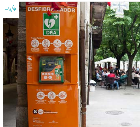
Imatge d’arxiu del programa Girona, territori cardioprotegit

çanes d’equipaments; disponibles perquè els pugui utilitzar qualsevol persona. A aquests dispositius cal sumar-hi la cinquantena de desfibril·ladors que es deixen temporalment a ajuntaments i a entitats per cardioprotegir activitats considerades de risc. Des de l’Organisme es forma gratuïtament i de manera continuada els usuaris intensius d’aquests aparells i s’ofereixen cursos més bàsics a tota la ciutadania