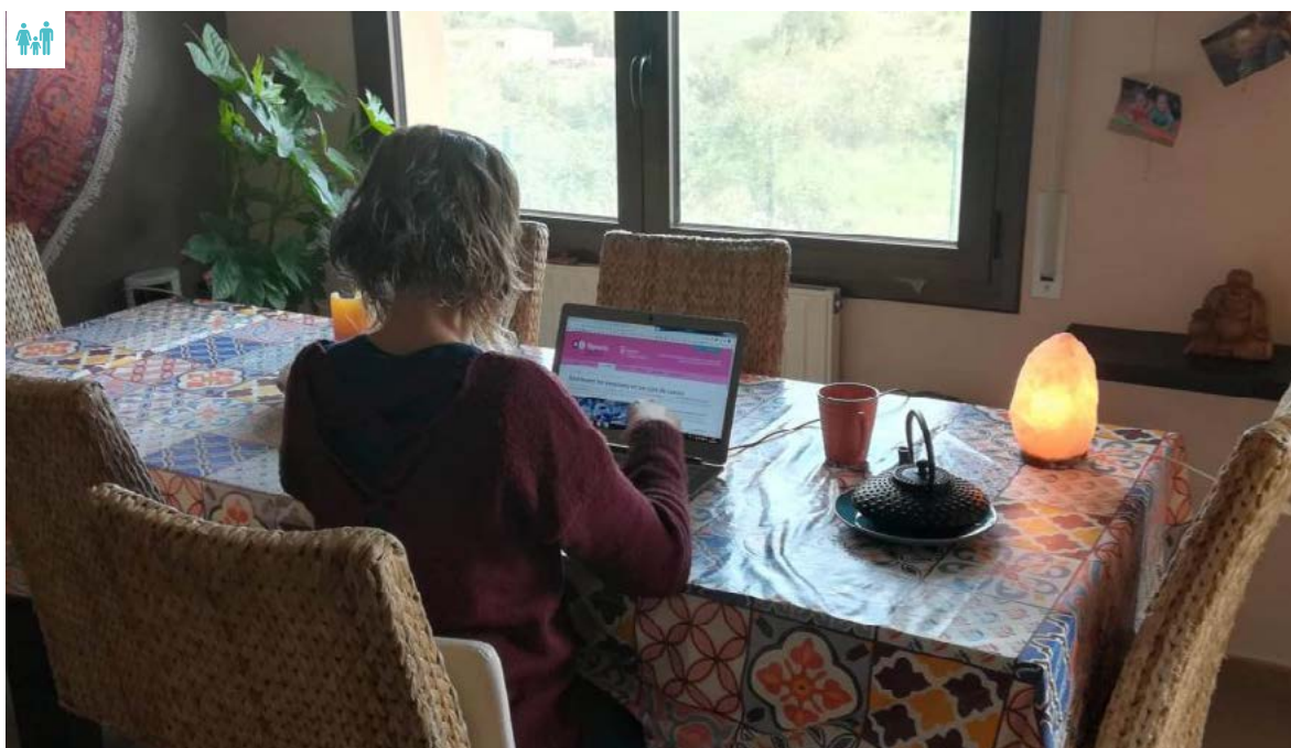
Una de les formadores conduint la primera sessió.

Aquest 2021, en continuem proposant. Podeu trobar-ne tota la informació al web www.siguestu.cat