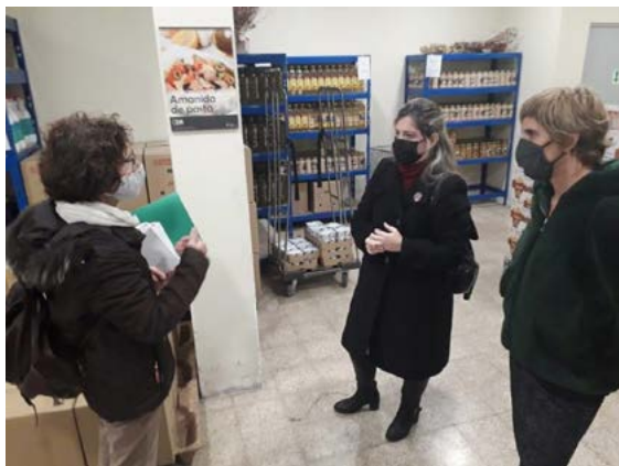
La presidenta de Dipsalut i la diputada d'Acció Social, al Centre de Distribució d'Aliments de Girona el mateix 14 de desembre

Dipsalut assumeix a l'entorn d'un 17% del finançament dels Centres de Distribució d'Aliments. A banda, s'han anat fent aportacions per abastir-los de productes imprescindibles i que no acostumen a arribar en quantitat suficient als centres. Des de l'Organisme també es promouen accions per proporcionar recursos, eines, a les persones per ajudar-les a sortir de la situació en la què es troben