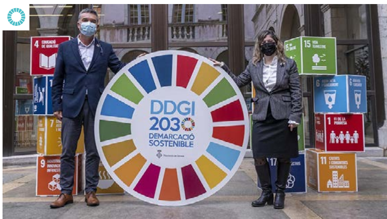
La presidenta de Dipsalut i vicepresidenta tercera de la Diputació de Girona el diputat de Desenvolupament Sostenible en la jornada d’aquest 11 de desembre

La Jornada ha estat concebuda com un punt de trobada de les administracions catalanes, el món de l’empresa, sindicats, universitats, entitats del tercer sector i ciutadania en general, per promoure el treball conjunt pels ODS. Hi han