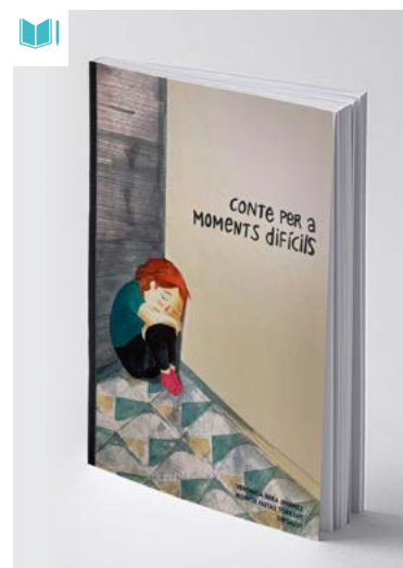
Portada del llibre: Conte per a moments difícils

centres educatius de la demarcació i a través d'activitats amb les famílies.