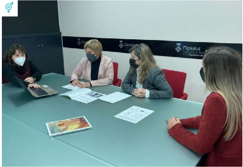
Imatge d'una reunió de treball sobre el programa entre la presidenta i la gerent de Dipsalut, la diputada d'Acció Social i una de les tècniques encarregades de l'assessorament

Les diferents actuacions es durien a terme de manera col·laborativa amb la resta d'administracions públiques que intervenen en aquests àmbits. En aquest sentit, la presidenta de Dipsalut i vicepresidenta tercera de la Diputació de Girona,