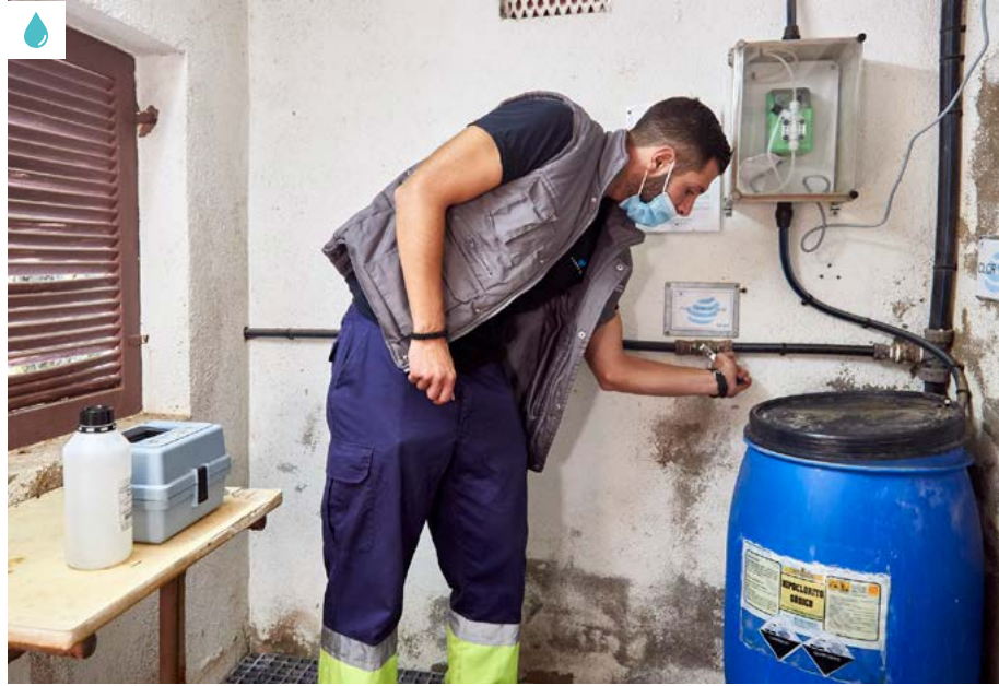
Imatge del Programa de Suport a la Gestió Municipal Directa dels Abastaments d'Aigua de Consum Humà

Després d'aquesta primera avaluació, s'agafen més mostres i es porten al laboratori per analitzar-les en profunditat. En aquestes anàlisis es comproven tots els paràmetres que marca la normativa com, per exemple, els metalls pesants, els nitrats, els compostos orgànics, els bacteris... Recentment també hi hem incorporat un nou paràmetre, la radioactivitat. En el cas que els resultats mostrin al-