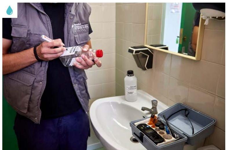
Imatge del Programa d'Avaluació i Control de la Qualitat de l'Aigua a l'Aixeta del Consumidor

“també oferim formació gratuïta al personal manipulador dels abastaments i xarxes de distribució. S'hi ensenya a aplicar els sistemes de prevenció i control de riscos”