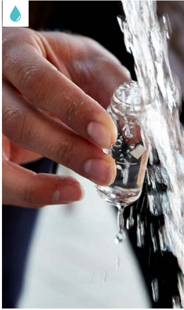
Imatge del Programa de Suport a la Gestió Municipal Directa dels Abastaments d'Aigua de Consum Humà